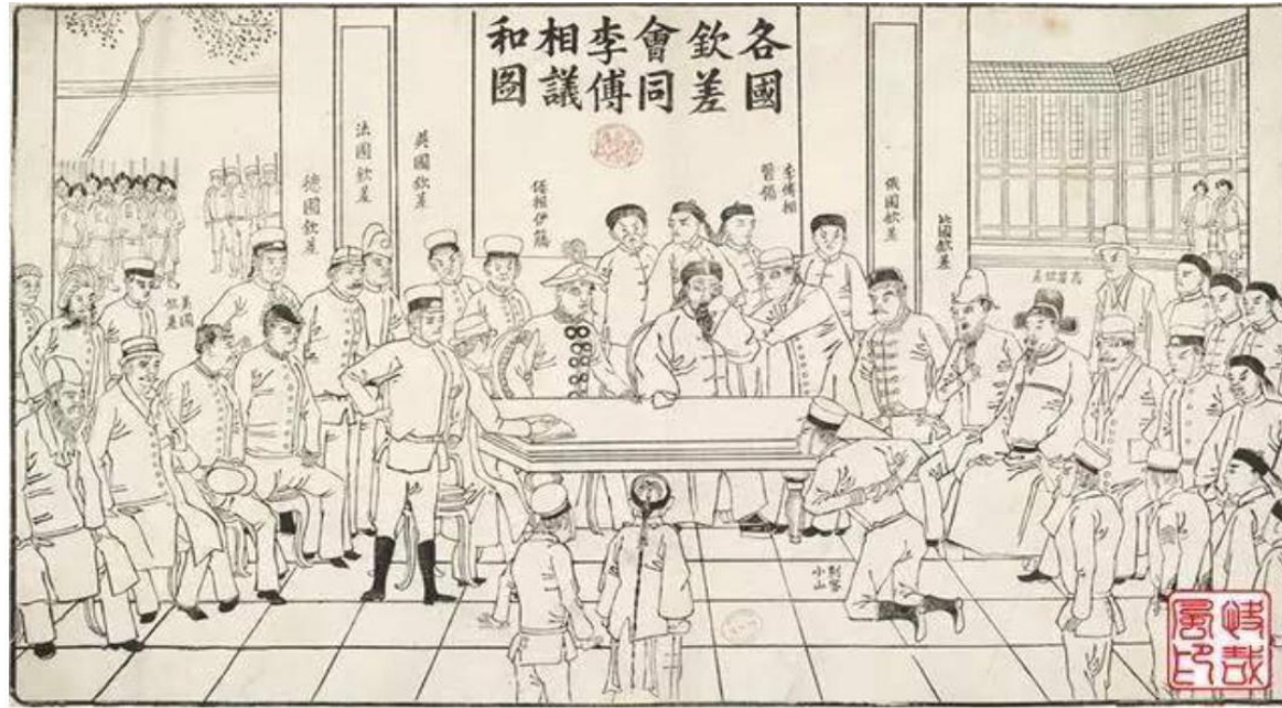
图十四：《各国钦差会同李傅相议和图》。李鸿章与各国钦差共审日本刺客，宽宏大度的签订了和约，日本举国感激。